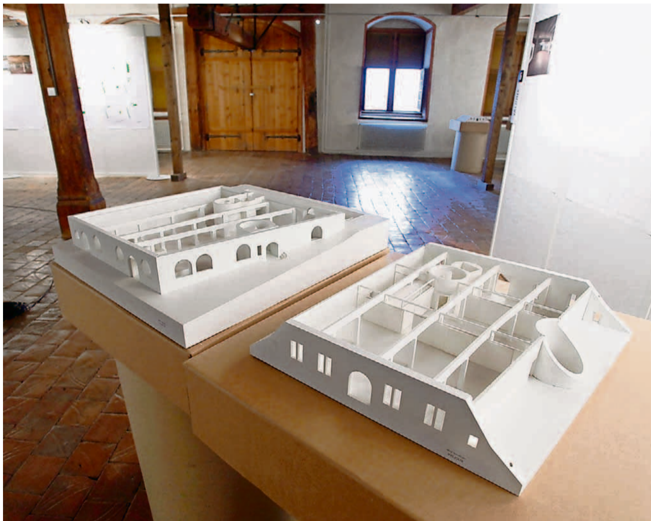
Modell des Siegerprojektes für den Umbau des Museums Altes Zeughaus.