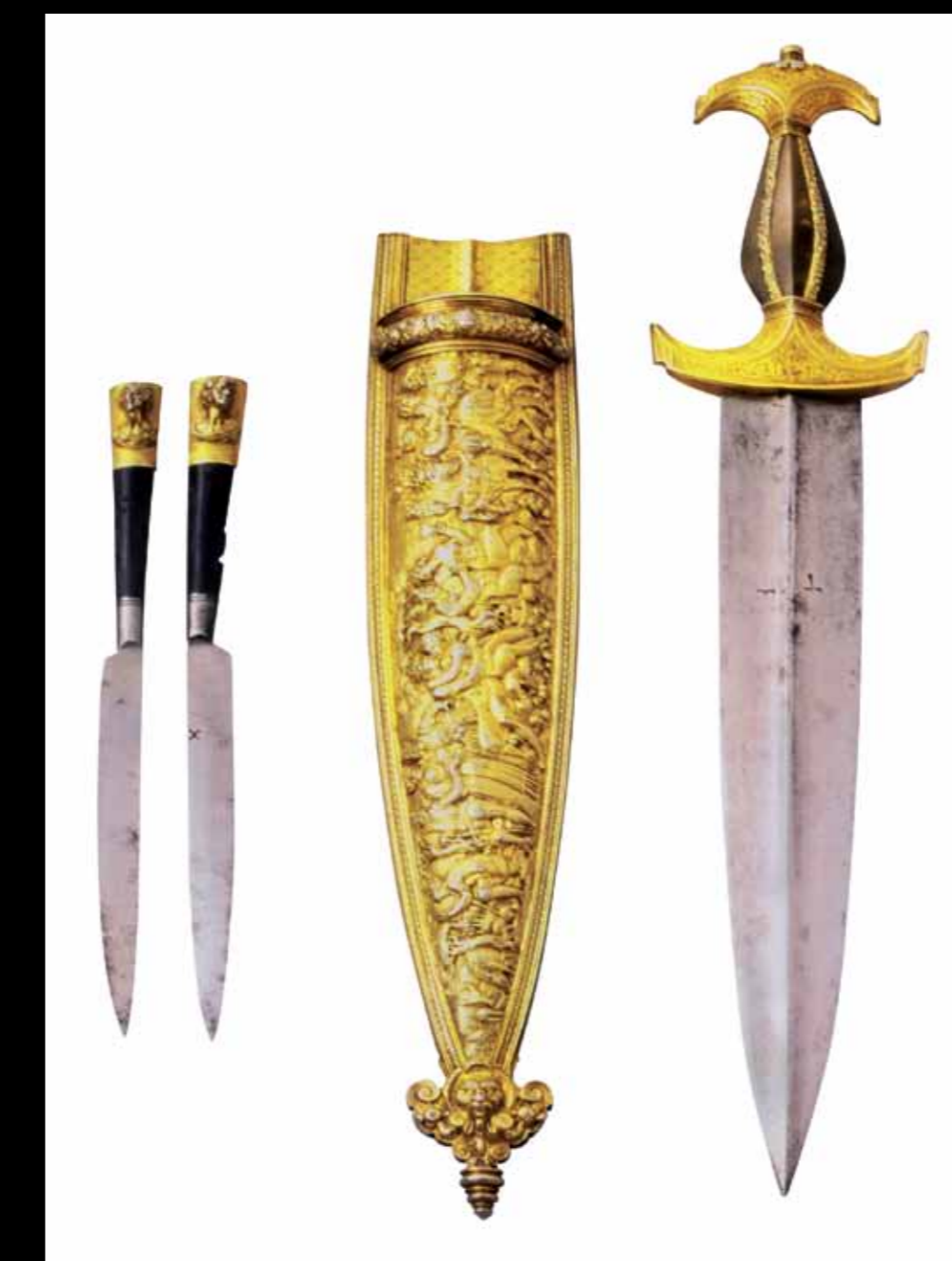
Prunkdolch mit Scheide und Besteckmessern, Basel, ca. 1585 (Hist. Museum Basel).

Der Künstler Urs Graf war selbst als Reisläufer an diversen Kriegen beteiligt und war auch im Alltag immer wieder in Gewalttätigkeiten verwickelt. Nach einer schweren Straftat musste er 1518 seinen damaligen Wohnort Basel überstürzt verlassen und ging vorübergehend nach Solothurn ins Exil. Seine Werke, die er meist mit einem Schweizerdolch signierte, sind von grosser Bedeutung: Ironisch widmete er sich seiner eigenen Welt, thematisierte das Leben der Reisläufer, das sinnlose Streben nach Tugend und zeichnete erotische und gewalttätige Szenen.