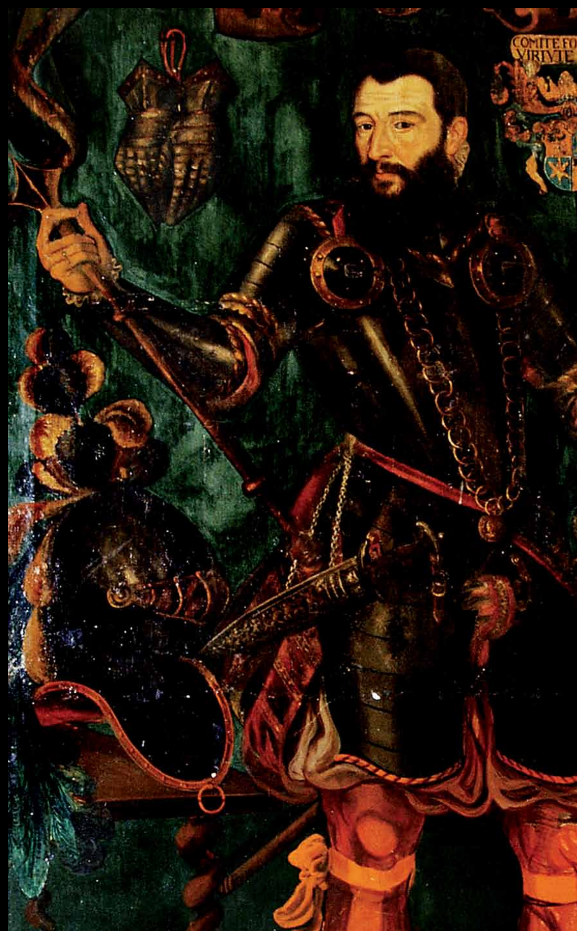
Der Söldnerführer Wilhelm Tugginer liess sich mit Schweizerdolch und zahlreichen weiteren Attributen in Rüstung porträtieren (2. OG, MAZ).

Der Dolch wurde stets waagrecht getragen, damit die Szenen auf der Scheide – beliebt waren Darstellungen aus der Bibel, aus der antiken Geschichte oder aus der Zeit der frühen Eidgenossenschaft – für alle ersichtlich waren. Tatsächlich in Gebrauch war der Dolch wohl kaum. Der Prunkdolch kostete ca. 20 Pfund, was ungefähr einem Jahreslohn eines Zürcher Plattners entsprach.