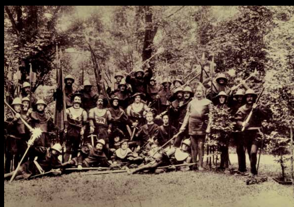
Szene aus dem Festspiel zum Jubiläum «Dornacherschlacht in Solothurn 29. / 30. Juni 1899» (Composition Verlag E. A. Wüthrich, Zürich).

Die Rückbesinnung auf alte Werte und auf eine stabil erscheinende Vergangenheit gab Halt in dieser unsicheren Umbruchsphase. Im Trend waren historische Jubiläumsfeiern und Schlachtengedenken. In diversen Kantonen wurden speziell für diese Feste einfache und prunkvolle Schweizerdolche in x-facher Ausführung nachgemacht. Ein grosser Teil der heute überlieferten Schweizerdolche stammt aus dieser Zeit.