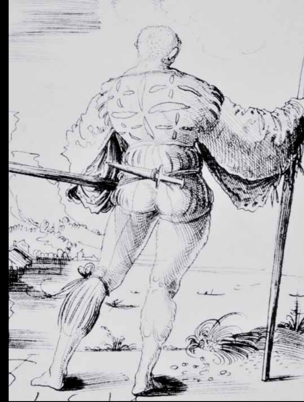
Die Reisläufer trugen den Schweizerdolch am Gurt auf dem Rücken (Urs Graf, um 1520).