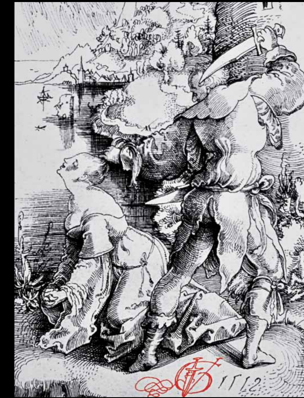
Urs Graf signierte seine Zeichnungen mit einem Schweizerdolch (Urs Graf, Federzeichnung, Enthauptung einer Frau vor Seelandschaft, 1519).